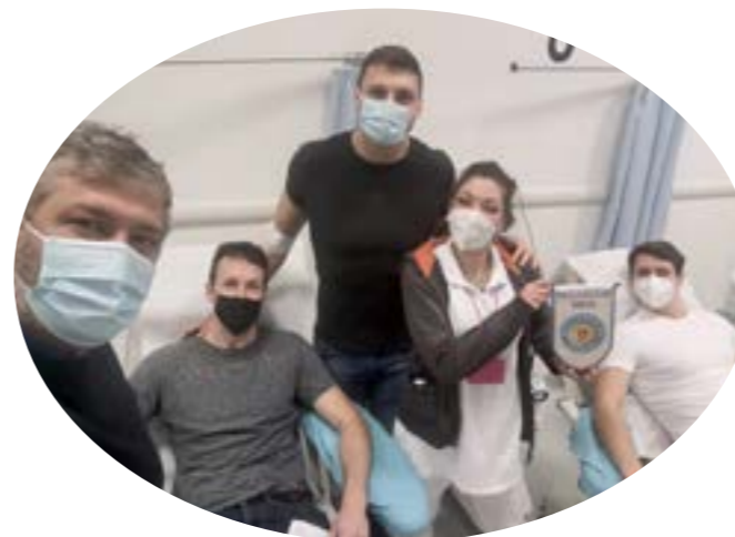
⚡ PALLANUOTO TRIESTE: un ringraziamento speciale a tutti gli atleti.