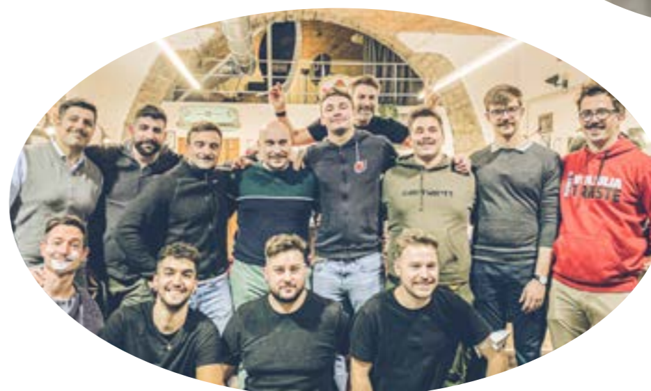
⚡ VENJULIA RUGBY: un ringraziamento speciale a tutti gli atleti.