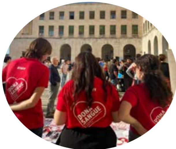
⚡ GRUPPO GIOVANI ADS: un ringraziamento speciale a tutti i ragazzi che ci aiutano nella promozione del dono del sangue.