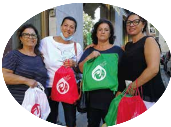
⤴ LE SORELLE RIZZI